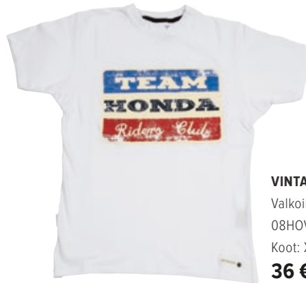
VINTAGE TEE TEAM HONDA Valkoinen 08HOV-T16-5-koko Koot: XS / S / M / L / XL / XXL 36 €