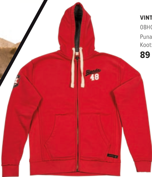
VINTAGE HOOD 48 08HOV-H16-1-koko Punainen Koot: XS / S / M / L / XL / XXL 89 €