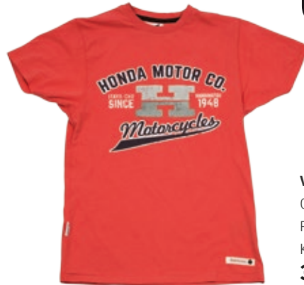
VINTAGE TEE BIG H 08HOV-T16-3-koko Punainen Koot: XS / S / M / L / XL / XXL 36 €