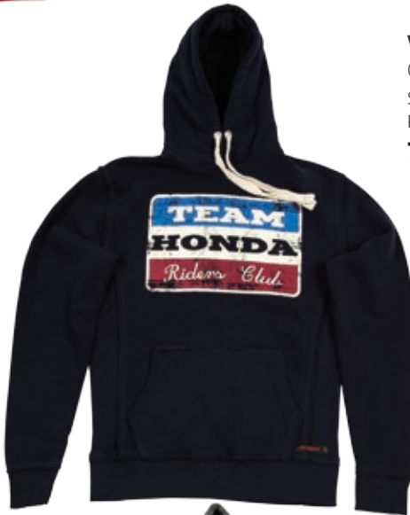
VINTAGE HOOD TEAM HONDA 08HOV-H16-6-koko Sininen Koot: XS / S / M / L / XL / XXL 79 €