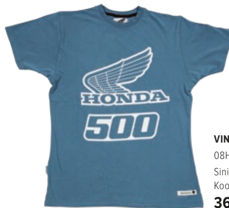
VINTAGE TEE 500 08HOV-T16-6-koko Sininen Koot: XS / S / M / L / XL / XXL 36 €