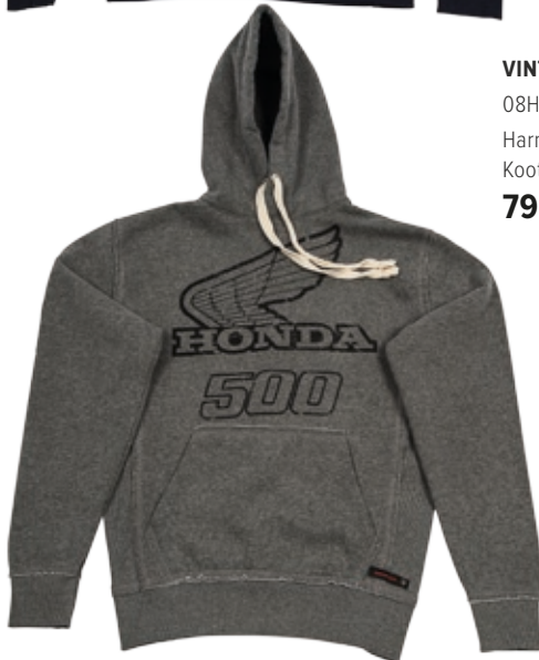
VINTAGE HOOD 500 08HOV-H16-7-koko Harmaa Koot: XS / S / M / L / XL / XXL 79 €